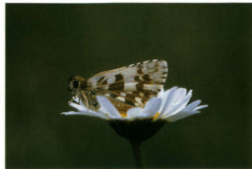
De opgave uit het augustusnummer.

Er waren negen inzendingen op de puzzelvlinder van augustus. Van die negen hadden zes personen het bij het juiste eind.