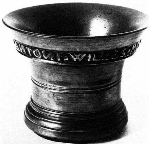
Vijzel van Antoni Wilkes, gegoten in 1656.

Als vele steden in de gouden eeuw, bezat ook Enkhuizen een geschut- en klokkengieterij, waarin vanaf 1613 tot 1777 verschillende gieters werkzaam waren. Daaronder tellen we de in Amsterdam geboren Jan Crans, die in 1714 te Enkhuizen woonachtig blijkt en in 1724 als 's Landsgeschutgieter te 's-Gravenhage aangesteld werd. Zijn zoon Cyprianus Crans, in 1703 te Amsterdam gedoopt, volgde zijn vader als klok- en geschutgieter te Enkhuizen op en hij werkte daar van 1727 tot 1733; in het daarop volgende jaar werd hij sradsklok- en geschutgieter te Amsterdam, in welke functie hij werkzaam bleef tot aan zijn dood in 1755.