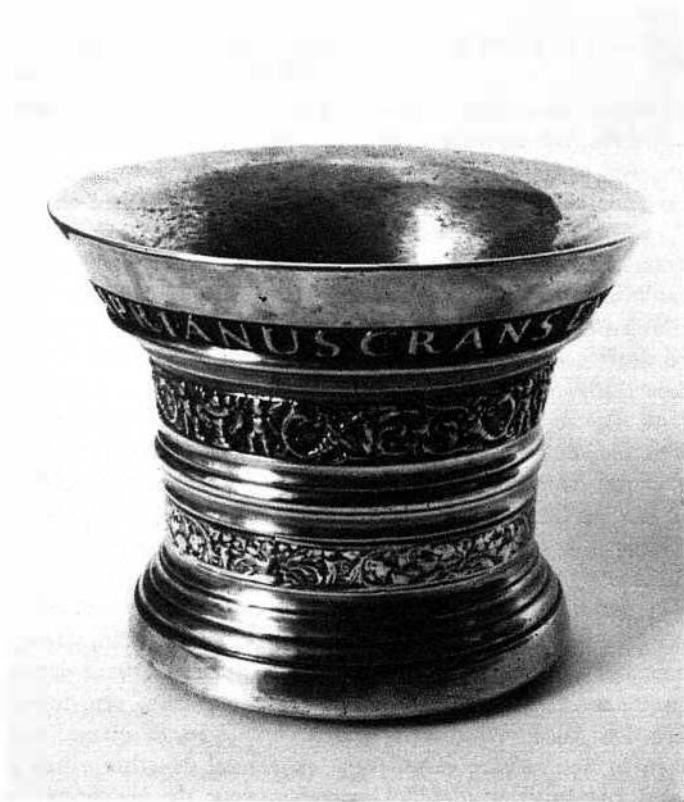
Vijzel van Cyprianus Crans, gegoten in 1729.

Het door het Zuiderzeemuseum verworven exemplaar is van het meer gedrongen cilindervormige type, naar boven en naar onder uitlopend, van binnen flauw gebogen en zich aan de top tot een kraag verwijdend. Tussen streng geprononceerde horizontale ringen aan de voer en om de flank zijn friezen gevat, waarvan de bovenste breder is en een omloop van putti met bloenvazen en hoorns van overvloed laat zien. De onderste fries is een lopende band van acanthusbladeren en ranken. Om de kraag windt zich het opschrift: „CYPRIANUS CRANS ENCHUSAE Ao. 1729” in latijnse kapitalen. De vijzel is 20,5 cm hoog en heeft aan de bovenrand een diameter van 26,3 cm.