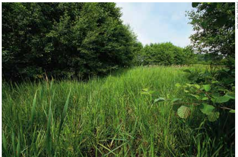
Een helofytenmoeras op Landgoed Hoosden waar de gevlekte glanslibel zich voortplant.

Uit de resultaten van dit onderzoek blijkt dat de voortplantingshabitat van de gevlekte glanslibel gekenmerkt wordt door bepaalde vegetatiestructuren en minder door de waterkwaliteit. De aanwezige vegetatie indiceert wel op elke locatie schoon en kwelrijk water, maar er lijkt geen directe invloed te zijn van de zuurgraad en de EGV. De vegetatiestructuren die