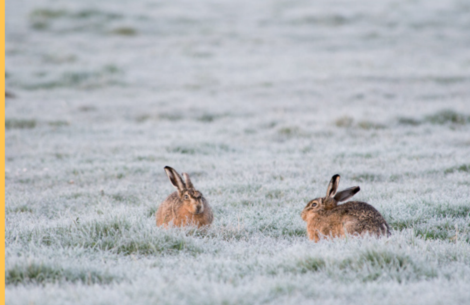
Hazen in berijpt weiland.