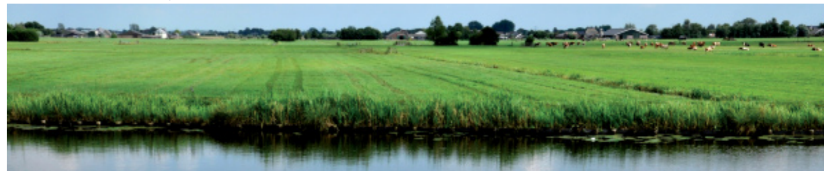
Gouda.