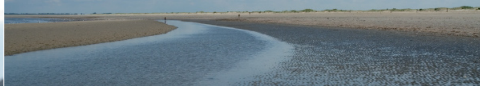
Goedereede.