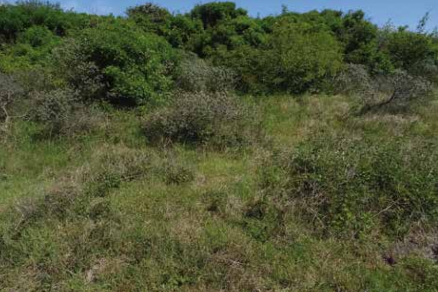
In vergraste duinen werden onverwacht veel aardbeivlinders gezien.

Westerduinen. Deze duincomplexen liggen relatief dicht bij de bekende vliegplekken en kenmerken zich door geaccidenteerde duinen met veel dauwbraam in lage vegetaties met relatief veel open zand. Van het Kapenglop wisten we bovendien dat hier volop bos-aardbei groeit en we waren nieuwsgierig of dat een aantrekkende werking op aardbeivlinders zou hebben. Inderdaad troffen we de soort in beide duincomplexen aan. De aantallen waren echter laag.