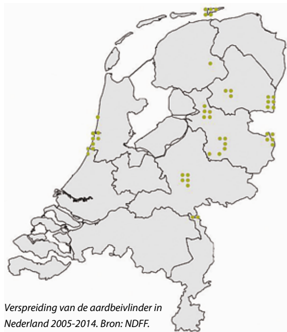
Verspreiding van de aardbeivlinder in Nederland 2005-2014.

negentig lag het aantal aardbeivlinders in Nederland beduidend hoger dan deze eeuw. Hoe de situatie op Schiermonnikoog toen was, weten we niet omdat er toen geen systematische tellingen zijn gedaan.