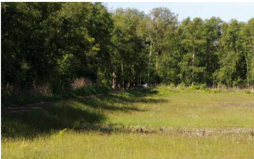
De Arnicavallei, habitat van de aardbeivlinder op Schiermonnikoog.

Hoewel Schiermonnikoog maar klein is, kent het dankzij deze variatie aan leefgebieden en de hoge mate van natuurlijkheid een rijke dagvlinderfauna. De afgelopen tien jaar zijn van het eiland dertig soorten gemeld.