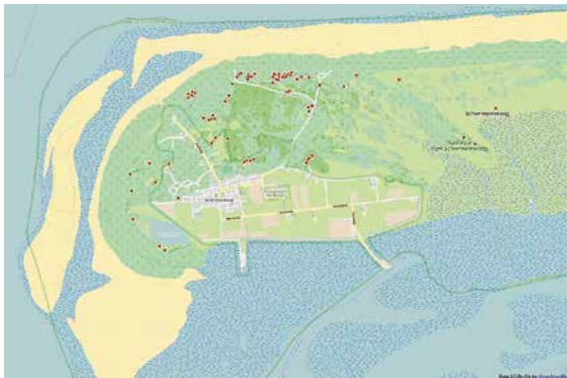
Verspreiding van de aardbeivlinder op Schiermonnikoog in 2014.

Onze telinspanningen richtten zich vervolgens op de zandige open duinen van het Kapenglop en de