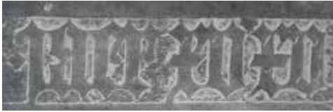
Afb. 3. 1515 op de steen.