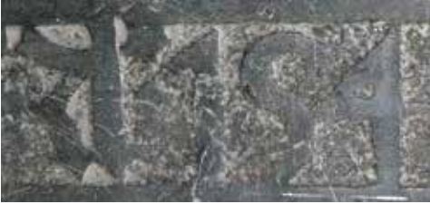
Afb 5. Een merkwaardig jaartal Ao 154.

notatie weergegeven, ook de dagaanduiding is 13 april en niet meer een heiligendag.