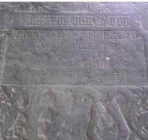
Afb. 7. Herman Van Egum kaapte deze steen.