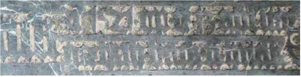
Afb. 6. Aan het begin van de bovenste regel staat Ao 1521.