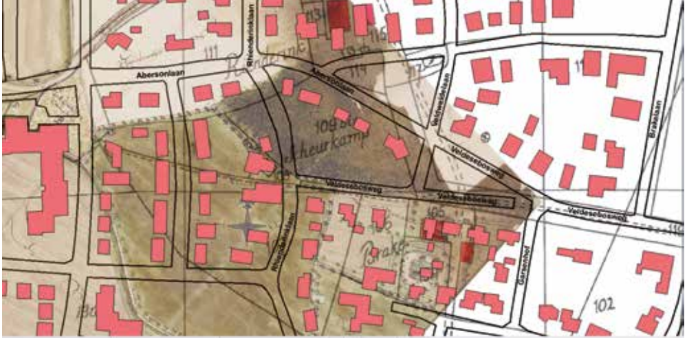
Uitsnede van het huidige straten- en huizenplan van Warnsveld met daarachter geprojecteerd de kaarten uit 1644 en 1832. (Diederik Rijs)