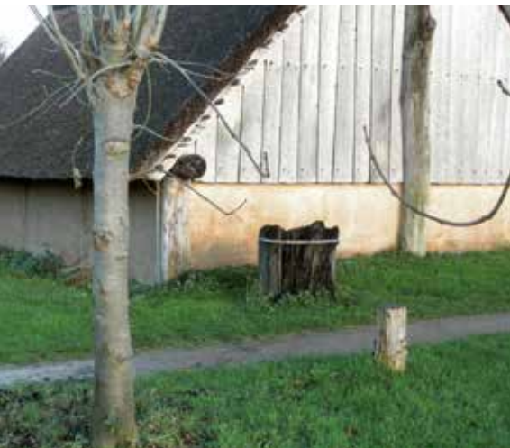
Restanten van de waterput van Rhienderink uit 1059 op het 'middeleeuwse erf' op de Kaardebol in Zutphen.