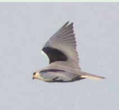
Grijze Wouw, Marnewaard, 21 augustus 2015

witte roofvogel op een torenvalk kast. Door de afstand kon ik niet direct zien wat het was. Toen ik eenmaal inzoomde met de telescoop zag ik een wit/lichtgrijze rover met een duidelijk donkere wenkbrauw, en iets van zwart in de vleugel. Het kwartje viel, maar ik kon nog niet bevatten dat er een GRIJZE WOUW in mijn beeld zat! In de minuten hierna waren de gevorkte staart en de zwarte vleugeltekening beter te zien, waarmee het echt niets anders kon zijn dan een Grijze Wouw. Ik probeerde gelijk de andere JNM-ers op het kamp te bellen, maar niemand nam op. Ondertussen vloog de vogel op en raakte ik hem kwijt. Stress! Gelukkig verscheen de vogel snel weer op de paal en kon ik Pieter van Veelen bereiken, die het op Dutch Bird Alerts zette en de Groningse vogelaars inlichtte. Het lukte mij een paar bewijsplaatjes te schieten met een spiegelreflex door de