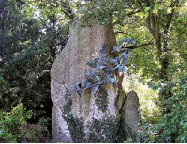
Het 'Heeresbriefftaubendenkmal' in Berlijn-Spandau.

Van de tweede patrouille kwam de eerste duif binnen 13,5 min. terug. Het diertje werd te 1.28 losgelaten. Alle zes duiven waren te 1.59 terug.