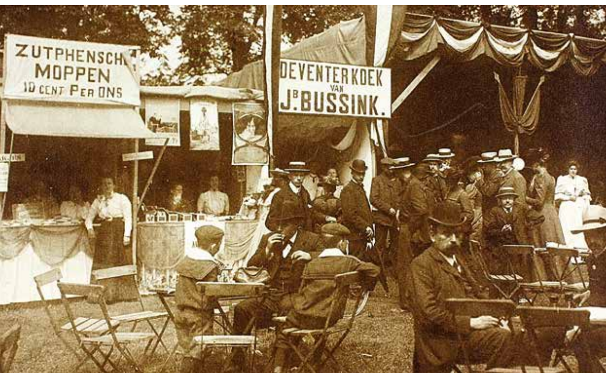
Een moment om alle indrukken van de landbouwtentoonstelling te laten bezinken.