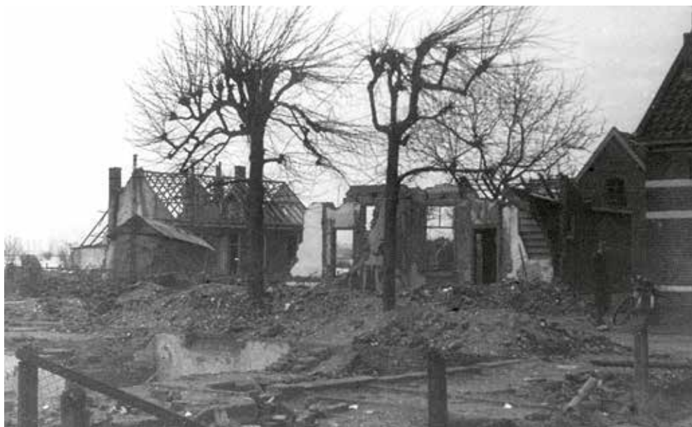
De trieste aanblik van de Molenbult, nadat daarop een Duitse VI was neergekomen. Er waren 12 dodelijke slachtoffers en veel gewonden.

feit zal zijn, vertrekt hij naar zijn standplaats in de Zutphense wijk De Hoven. Van daaruit wordt hij met zijn regiment ingezet en maakt hij de eerste oorlogsweken mee. Zijn dagboek is een persoonlijk verslag, dat ons een authentiek beeld geeft van wat zich in die dagen onder zijn ogen afspeelt.