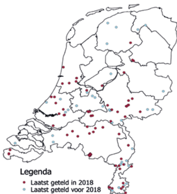
Figuur 1. Alle getelde meetpunten over alle jaren. Van de rode stippen zijn de gegevens van 2018 al binnen.

Tekst: In Noctua, het databestand van De Vlinderstichting en de Werkgroep Vlinderfaunistiek, staan momenteel al meer dan 6.000.000 nachtvlinderwaarnemingen. Deze waarnemingen zijn onder andere afkomstig uit waarneming.nl en telmee.nl, maar ook van losse waarnemingslijstjes. Deze gegevens worden gebruikt om verspreidingskaartjes en vliegtijd diagrammen te maken, maar om iets over de veranderingen in aantallen te kunnen zeggen zit te veel verschil tussen al deze waarnemingen. Dat komt onder andere doordat mensen af en toe een waarneming doorgeven, andere mensen van elke soort één exemplaar doorgeven en weer andere tellingen of schattingen doen van de aantallen. Daarnaast zijn er grote verschillen in het type lamp dat mensen gebruiken; ook dat heeft een grote invloed op de hoeveelheid vlinders die worden gevangen. Ook is er nog verschil in tijdsduur: sommige mensen vangen een hele nacht en andere slechts een paar uurtjes.