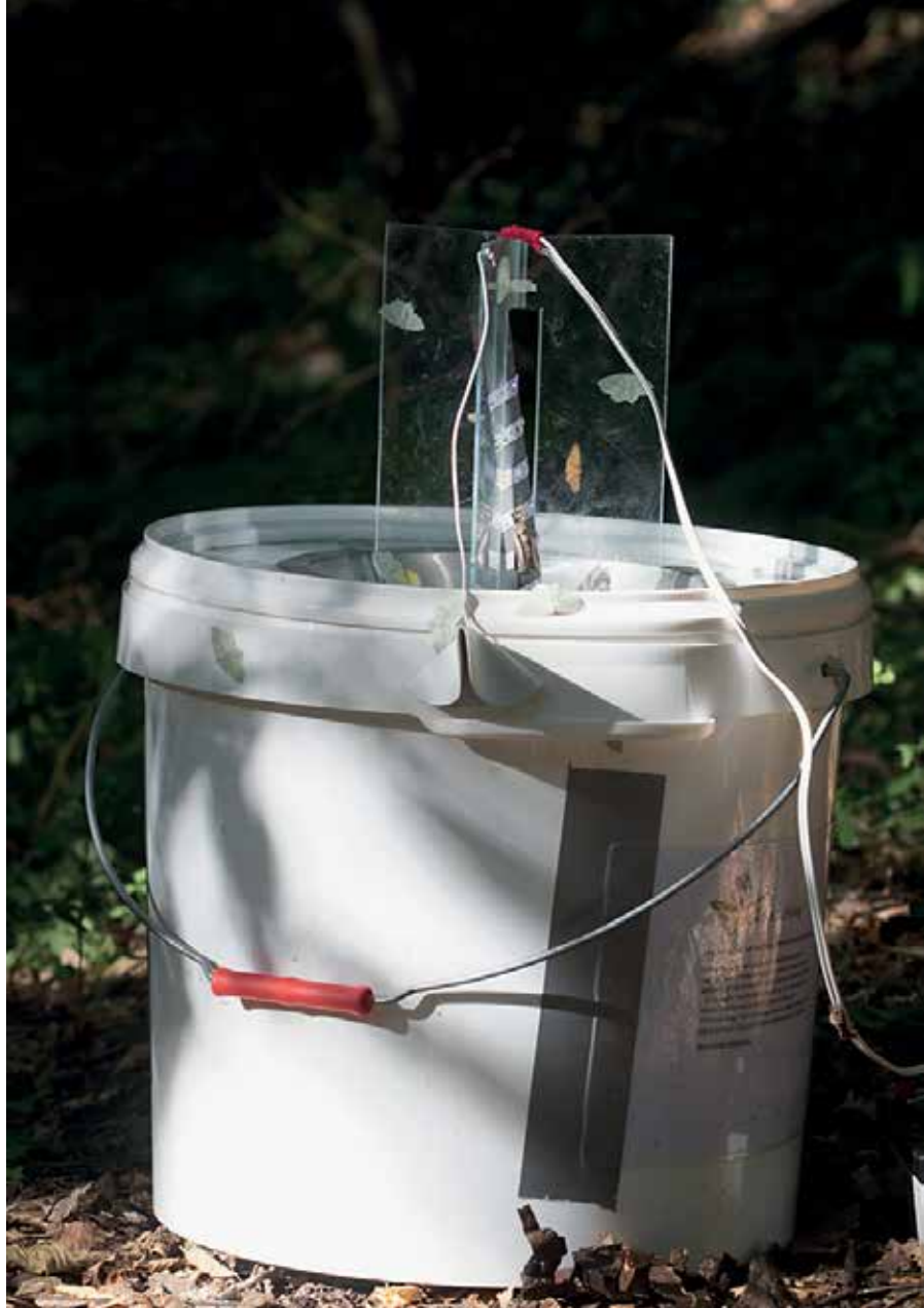
De nieuwe nachtvlinderval werkt met led in plaats van tl-buisjes.

Voor het meetnet nachtvlinders zijn we nog hard op zoek naar extra meetpunten. Alle waarnemingen die met een val zijn gedaan, zowel in tuinen, natuurgebieden als agrarische gebieden, zijn welkom. Wilt u meedoen, kijk dan hoe het werkt op de pagina van het Landelijk Meetnet Nachtvlinders op www.vlinderstichting.nl .