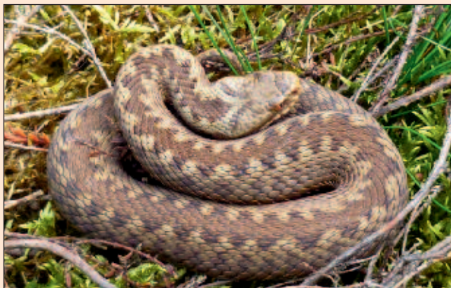
Adder op het Hijkerfeld